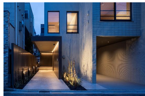
エントランスホール/エントランス