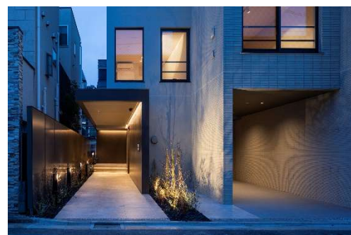
エントランスホール/エントランス